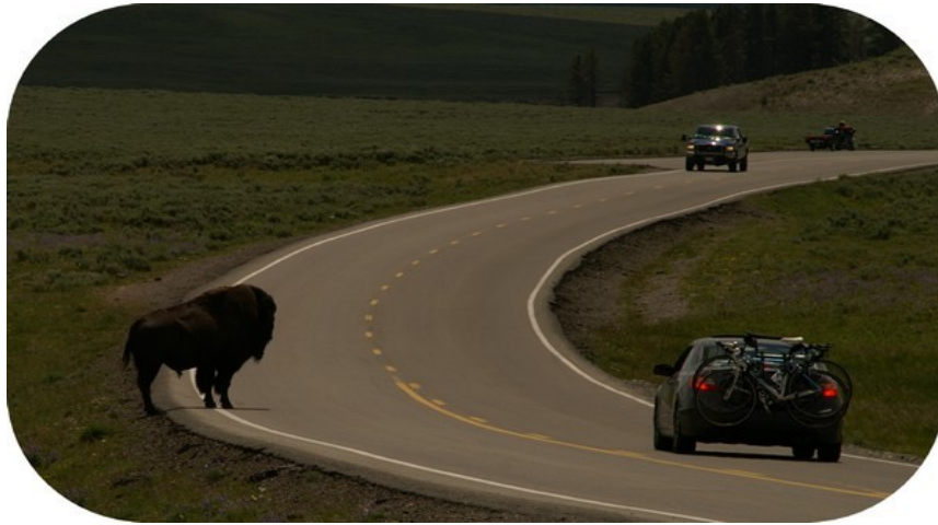
Vigepligt for bisoner?

Vi kørte videre langs Yellowstone River mod Yellowstone Lake. Træerne langs vejen er tydelig belastet af kronhjortenes skraben med gevirene. Vi så flere kronhjorte og nogle bisonokser på turen. Vi gjorde holdt ved nogle varme kilder med kraftig svovlslugt og muddervulkaner.