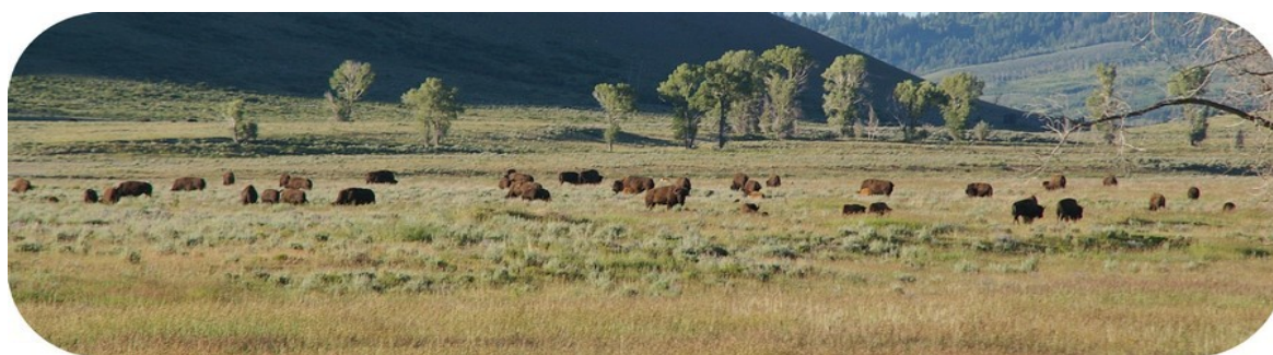
Bisonner i hobetal, flokken var nok på et par hundrede.

Vi forsøgte flere camperpladser uden held, og så var vi efterhånden kommet til Yellowstone National Park, og her talte vi med en ranger, som anbefalede os at køre tilbage, så derfor må vi spole lidt baglæns. Det viste sig, at der gemte sig en masse gode oplevelser, selv om det var lidt surt at køre tilbage.