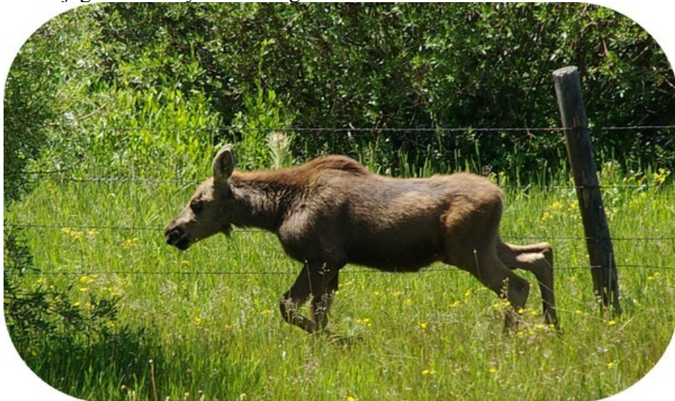
Den lille elg var kommet på forkert side af hegnet.

Ca. 12.40 drejede vi fra hovedvejen for at finde et godt sted at spise frokost. Vi kørte på en grusvej og det rystede, så jeg fik gammel-tante-skrift, og det kan ind i mellem være svært at tyde, hvad der står i dagbogen. Ti minutter senere gjorde vi holdt ved Boulder, hvor der kunne fiskes, og der var også fiskeopdræt. Her smurte vi madder i bilen og satte os ud på hver sin sten og nød solen og vores frokost. Kort tid efter var vi atter på farten, og snart var vi ved Pinedale, en gammel Western by, som ligger i 7000 fod, en by med 1400 indbyggere. Lige udenfor byen så vi en stor flok prærie antiloper, som blev jaget af en coyote eller lignende.