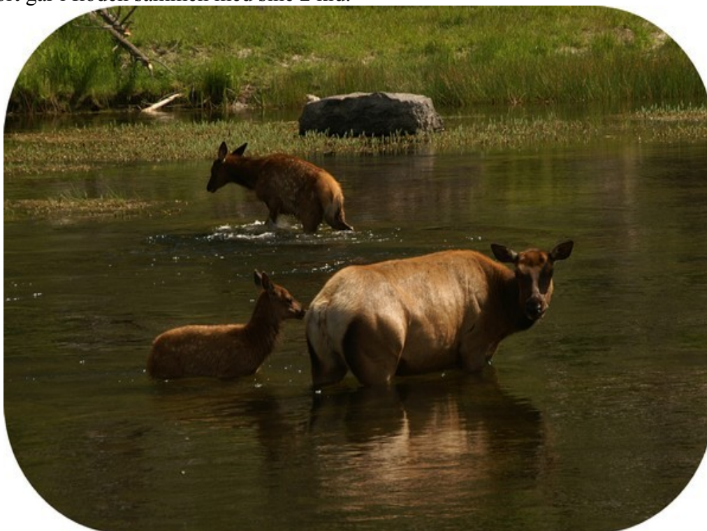
Kronhjortehind med kid.

Vi planlagde udflugt til Yellowstone nok en gang, vi blev simpelthen ikke færdige med den dejlige park i går. Vi forlod derfor campladsen med aftale om at komme igen til endnu en overnatning. Vi var næppe indenfor Yellowstone, før vi blev forstyrret af de første dyr på/ved vejen. Dyrene sætter dagsordenen for trafikken i dette dejlige naturmekka. Trafikken går ofte helt i stå, alle farer ud af bilerne bevæbnet med fotografiapparater, videokameraer og kikkerter. Smukt ser det da også ud når en kronhjort går i floden sammen med sine 2 kid.