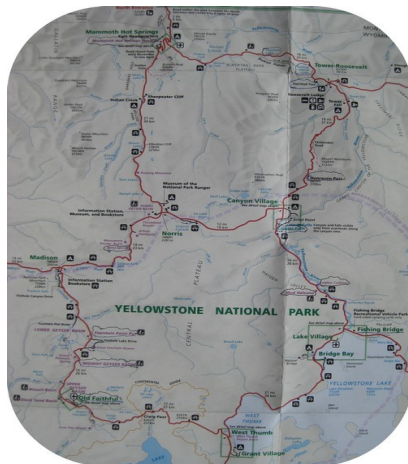
Kort over Yellowstone, vi har kørt hele 8 tallet rundt.

Vi var hjemme ved camper-pladser ved ni-tiden, men vi valgte at spise på restaurant ”De tre bjørne”, den lå tæt på pladsen, så det var fristende at slippe for madlavning med den sene hjemkomst.