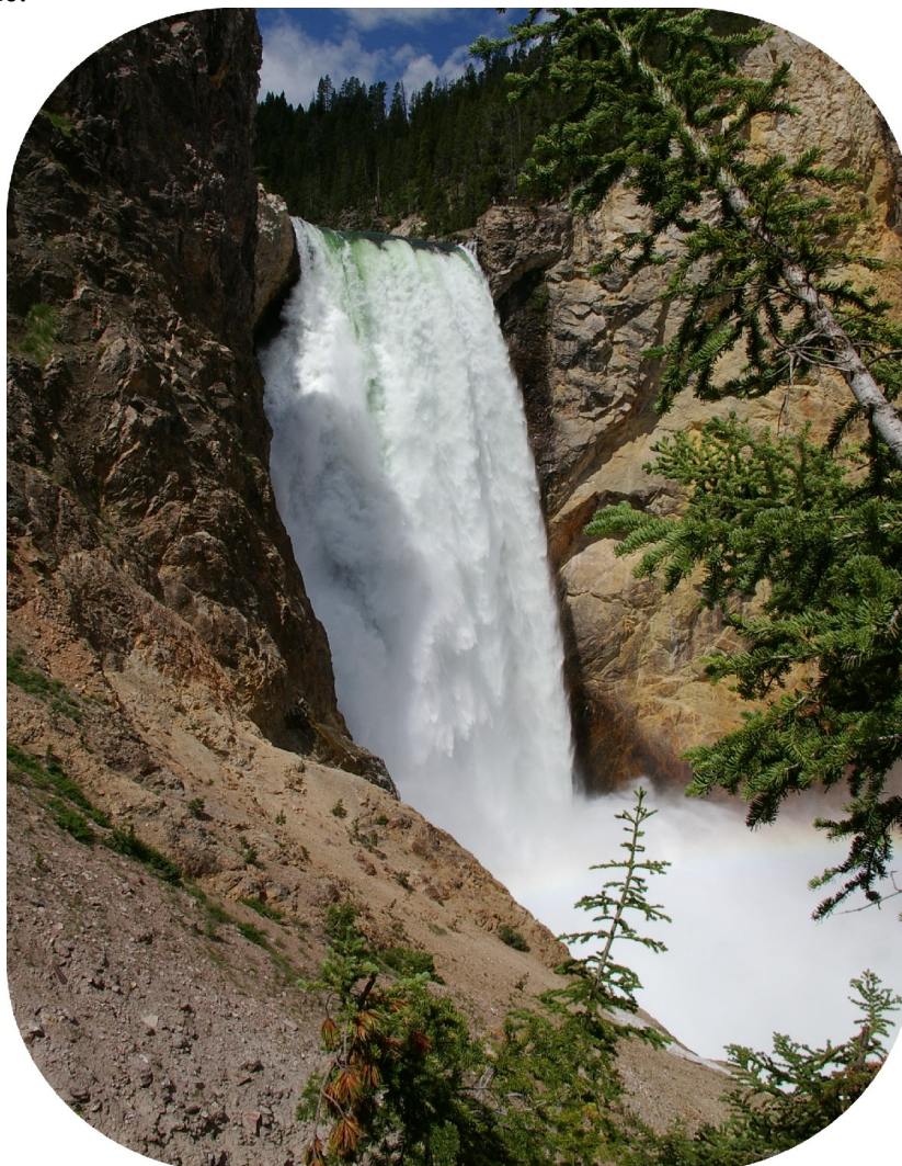
Yellowstone Lower Falls.

Vi kørte ellers direkte til Yellowstone Grand Canyon for at se Lower Falls med sol ind fra den rigtige side. Lower Falls er det højeste (94 meter) af de to vandfald (Lower og Upper Falls). Man parkerer i højde med det øverste, og går så ad mere end 300 trapper ned til en udsigtsplatform, hvor vi kunne nyde det store vandfald. Det var let at tage turen ned, vi måtte hvile lidt mere på tilbageturen. Vandfaldsområdet ligger i næsten 8.000 fod, det kan mærkes, så vores ben er ikke så hurtige i den højde.