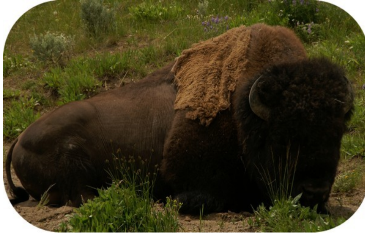
Bison ligger og tygger drøv.

Vi kørte videre langs Yellowstone River mod Yellowstone Lake. Træerne langs vejen er tydelig belastet af kronhjortenes skraben med gevirene. Vi så flere kronhjorte og nogle bisonokser på turen. Vi gjorde holdt ved nogle varme kilder med kraftig svovlslugt og muddervulkaner.